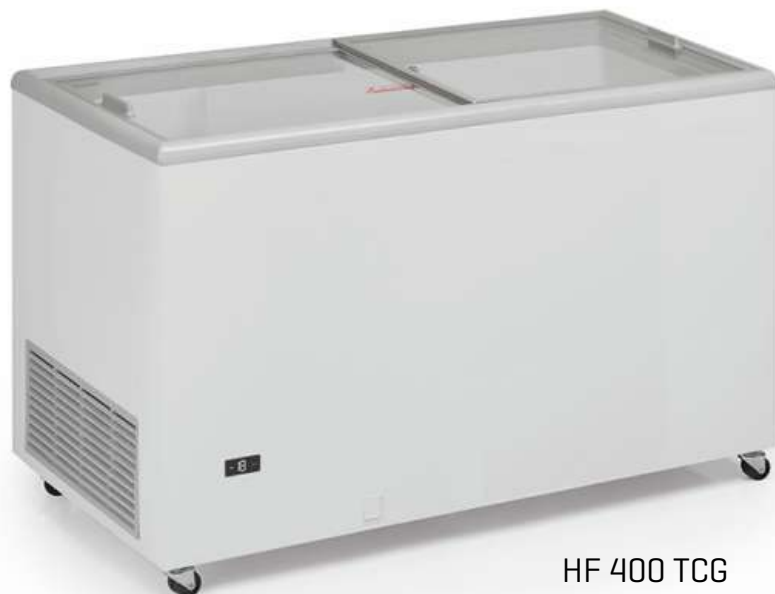
HF 400 TCG

Controlador digital Adjustable thermostat Thermostat réglable