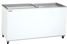
Horizontales puerta de cristal