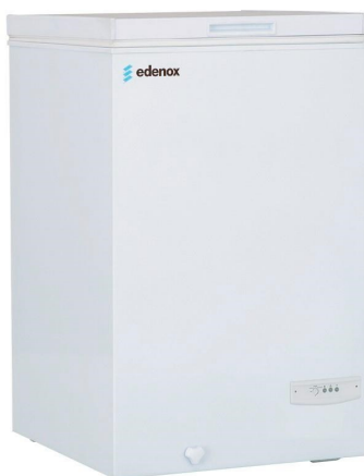
Frio Comercial - Congeladores horizontales - Horizontales puerta ciega abatible - Puerta abatible hasta 1,5 m