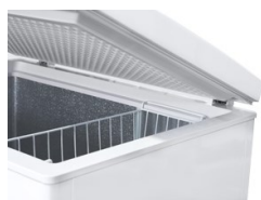
Horizontales puerta ciega abatible Accesorios