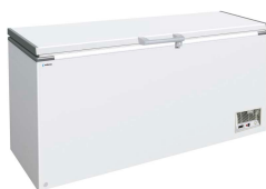
Horizontales puerta ciega abatible Puerta abatible hasta 2 m